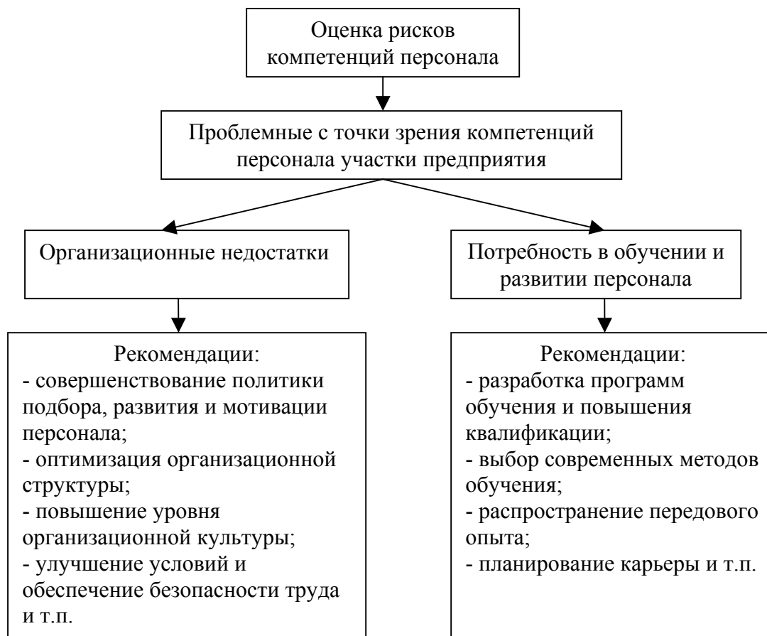
Рис. 2 Использование результатов оценки рисков компетенций при планировании обучения и развития персонала.

Таким образом, предлагаемая методика подразумевает разделение процесса реализации альтернатив, связанных с управленческим решением на стадии, на каждой из которых идентифицируются риски компетенций персонала и оцениваются по их качественным и количественным характеристикам. Результатом методики является составление карты оценки рисков по данной альтернативе и расчет обобщающего показателя риска в виде оценки приемлемости альтернативы. Оценка приемлемости альтернативы используется в качестве критерия выбора варианта решения, оптимального по фактору компетенций персонала. Карта оценки рисков и показатели оценки рисков могут применяться для определения направлений обучения и развития персонала предприятия.